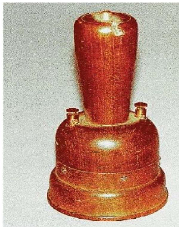
Fig. 9. Marconi's reconstruction of Meucci's 1857-67 Telephone. (Photo by Maurizio Ghisellini for Basilio Cantania in the early 1990's).